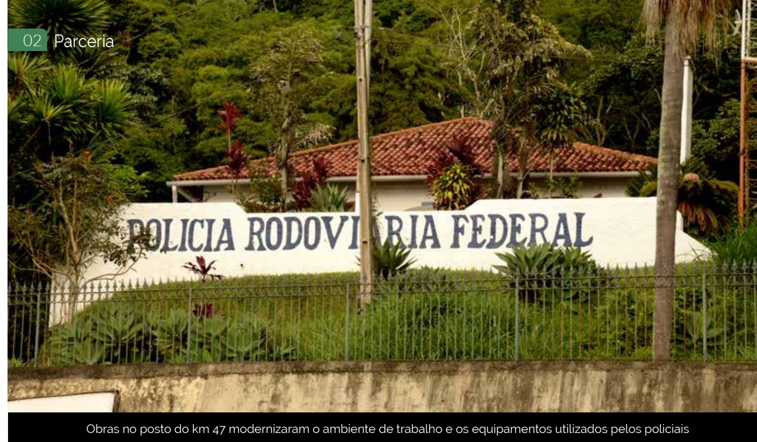
Obras no posto do km 47 modernizaram o ambiente de trabalho e os equipamentos utilizados pelos policiais