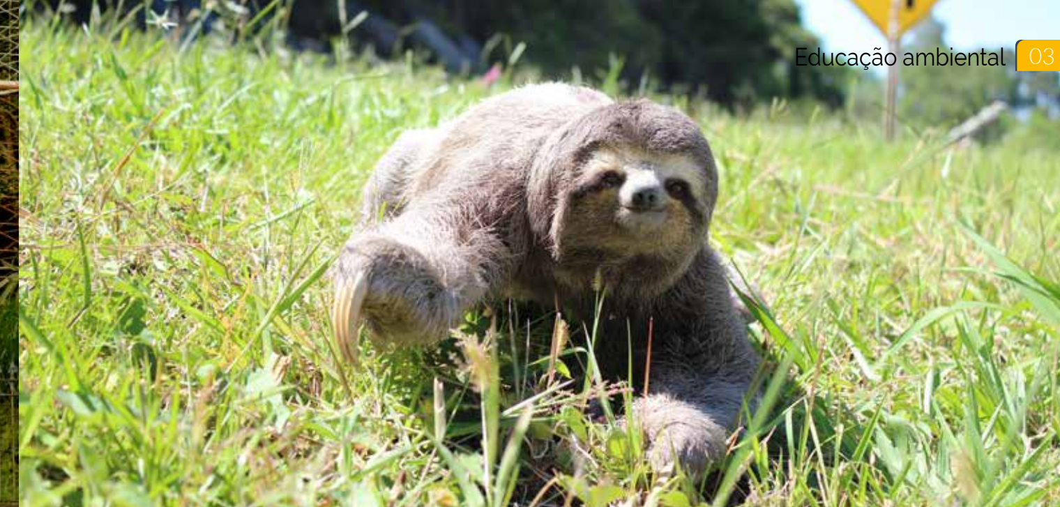
O principal objetivo do projeto é evitar e monitorar os atropelamentos de animais silvestres ao longo da rodovia

Veículos e equipamentos -. Além das reformas, a PRF vem recebendo equipamentos e veículos, beneficiando principalmente a 6ª DPRF, baseada em Petrópolis, que cobre uma extensão maior da rodovia. As outras duas unidades estão situadas em Duque de Caxias e Juiz de Fora. Além do convênio, a Concer mantém um estreito relacionamento institucional e operacional com a PRF, que previne e reprime a criminalidade e casos de violência nas rodovias federais.